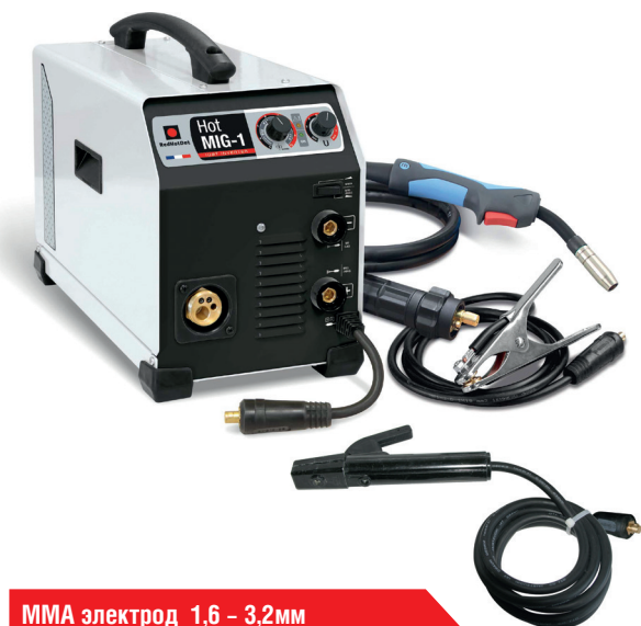
MMA электрод 1,6 – 3,2мм

Профессиональный инверторный сварочный аппарат класса «А» промышленного назначения для полуавтоматической сварки в среде защитного газа (MIG/MAG) и сварки стали и чугуна электродами с покрытием (MMA). Аппарат управляется простым поворотным регулятором с настройкой сварочного тока в диапазоне от 10 до 200 А. Отличается малыми размерами и небольшим весом.